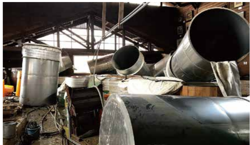
水害の被害に遭った直後の工場内。浮き上がった移動した貯蔵用のタンクは散乱し、仕込み用の甕の多くが被害を受けました