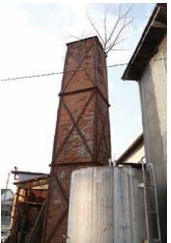
写真左／明治時代以前の焼酎造りを再現するために自作された「兜釜蒸留機」 写真中／蔵元の経営権を得た下田伯熊さん 写真右／燃料に石炭を使った時代の恐はせるレンガ造りの煙突が残っています